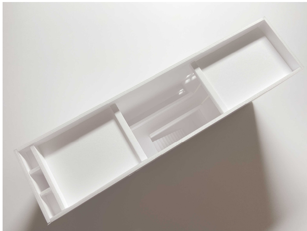
安藤忠雄 住吉の長屋

建築設計の仕事において、模型は重要なツールです。 参加者の方には、「住吉の長屋（安藤忠雄）」か、「塔の家（東孝光）」のいずれかを選んでいただき、50分の1スケールの白模型を制作します。 建築の模型がつくられる過程を、ぜひ体験してください。