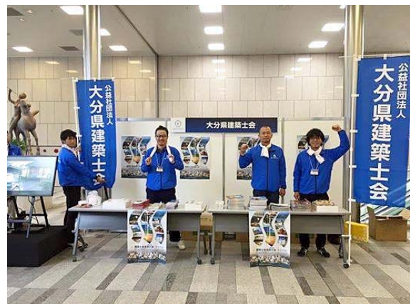
大分大会のPRブースにてパンフレットや 大分銘菓を配りました