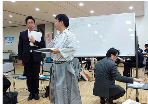
大青年フォーラム会当日の受付の様子