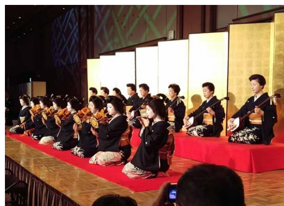
大交流会にて伝統芸能・金沢素囃子