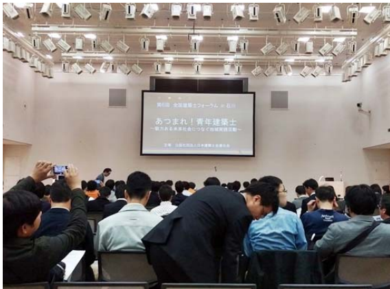
前日に行われた全国建築士フォーラム